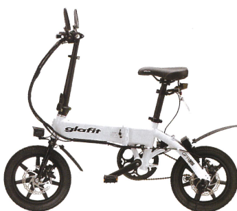
□ SHIRAHAMA WHITE