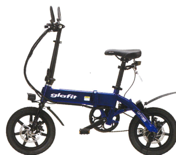
■ TIDE BLUE