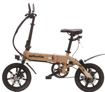
■ MATTE BEIGE

① ナンバー登録が必須です ② 自賠責保険の加入が必須です ③ ヘルメットの着用が必須です ④ 第一種原動機付自転車を運転することができる免許の携帯が必要です ⑤ 車道を走る必要があります ⑥ バッテリー切れ時には（ペダル走行モードでも）走行することはできません